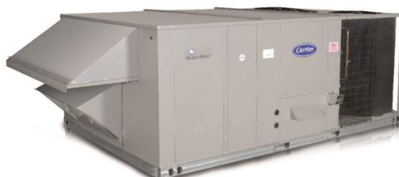
Equipos desde 15 hasta 30 Toneladas de Refrigeración