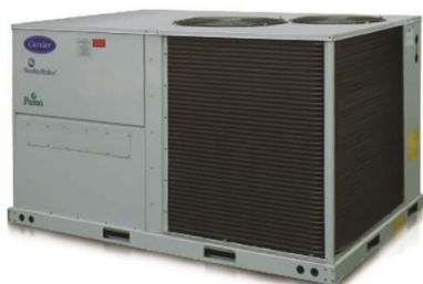
Equipos de 10 y 12,5 Toneladas de Refrigeración