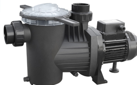
TABLA DE PRESTACIONES