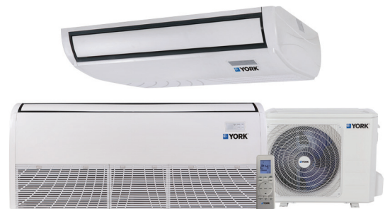
Piso Techo YFKE (18-55) - Bomba de Calor

La condensadora (unidad externa) y evaporadora (unidad interna) están diseñadas para un funcionamiento silencioso.