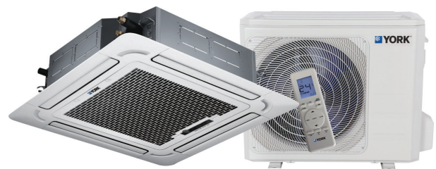
Cassette YTKE/YKKE (12-55) - Bomba de Calor