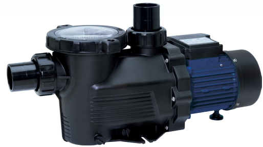
TABLA DE PRESTACIONES - 2900 vpm