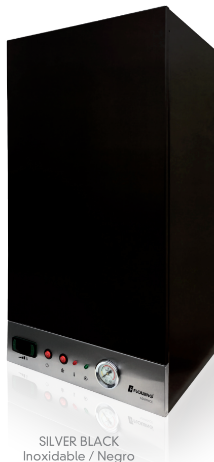
SILVER BLACK Inoxidable / Negro

Diseñadas para trabajar con radiadores, piso radiante o fan-coils. Los modelos doble servicio, adicionalmente, le permiten contar con abundante agua caliente.